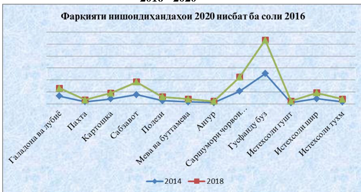
Диаграммаи 3.1. Ҳаҷми истеҳсоли маҳсулоти кишоварзӣ дар соли 2016 - 2020

Сарчашма: ҳисоби муаллиф аз рӯи маълумоти оморӣ// Кишоварзии Ҷумҳурии Тоҷикистон 2021. Маҷмуаи оморӣ. Агентии омили назди Президенти Ҷумҳурии Тоҷикистон