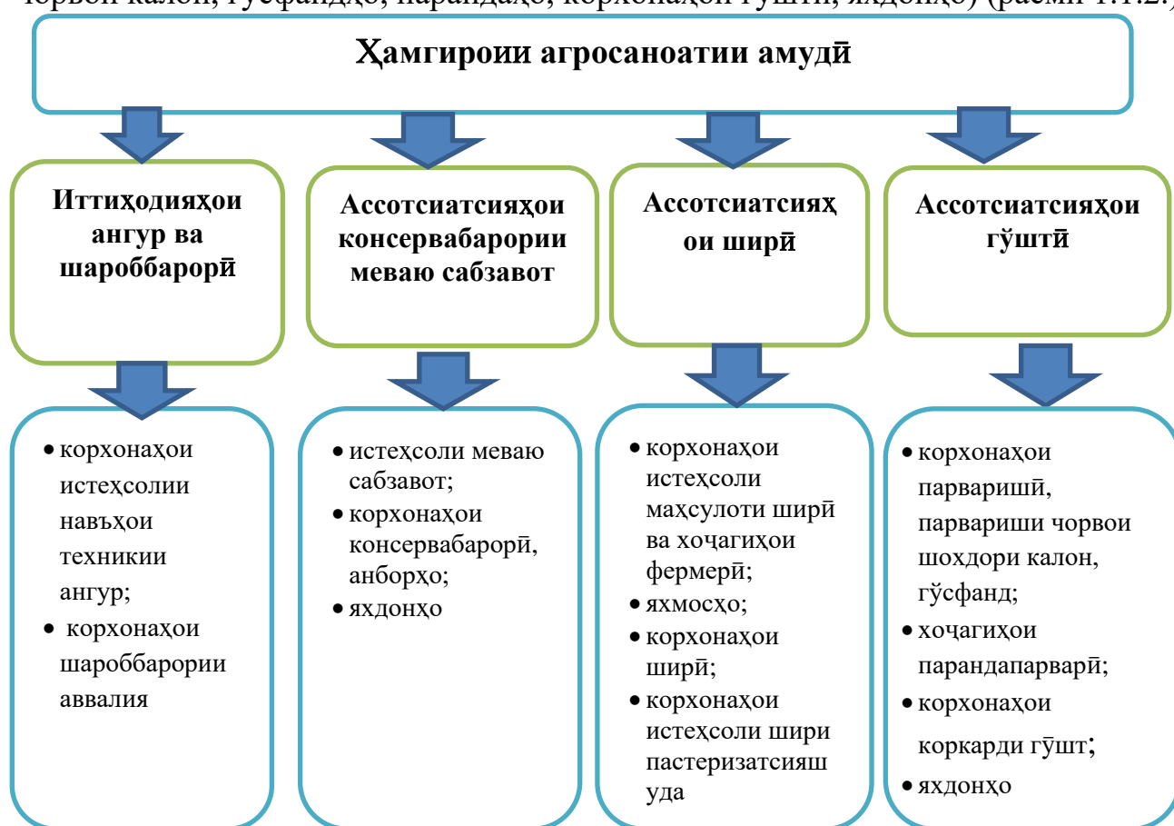
Расми 1.2. - Намунаҳои ҳамгироии амудии агросаноатӣ

Дар доираи ҳамгироии амудии агросаноатӣ блокҳо (ассотсиатсияҳо) нисбатан мустақил фаъолият мекунанд, ба монанди системаи зерин: ангур ва шароб, корхонаҳои истеҳсоли навъҳои саноатии ангур (истеҳсоли шароб аз ангур); консервабарории меваю сабзавот (истеҳсоли мева ва сабзавот, консерваҳо, анборҳо, яхдонҳо); маҳсулоти ширӣ (комплексҳо ва хочагиҳои ширӣ, корхонаи ширӣ, корхонаҳои коркарди маҳсулоти шир); гӯшт (корхонаҳо барои парвариши чорвои калон, гӯсфандҳо, парандаҳо, корхонаҳои гӯштӣ, яхдонҳо) (расми 1.1.2.).