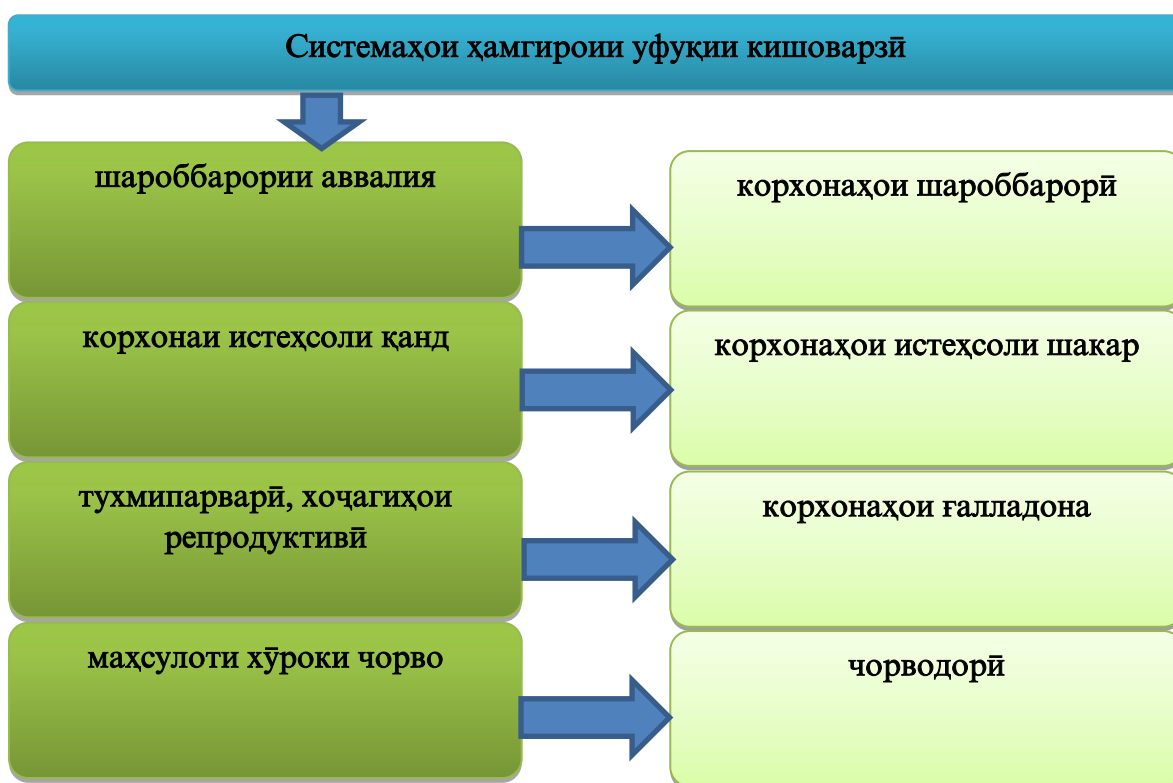
Расми 1.1.1.- Робитаҳои истеҳсолӣ ва иқтисодии низомҳои ҳамгирии уфуқии агросаноатӣ

Шакли муваффақтарини системаи ҳамгирии уфуқии агросаноатӣ иттиҳодияҳои илмию истеҳсолӣ мебошанд, ки корхонаҳои кишоварзиро дар якҷоягӣ бо зерқисматҳои илмӣ дар бар мегиранд. Амалия нишон медиҳад, ки рушди ҳамгирии уфуқии агросаноатӣ омили муҳим дар гузариши тадриҷӣ аз сохтори гуногунрангсозӣ ба сохтори махсуси соҳавӣ мебошад.