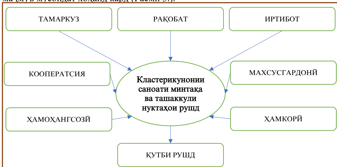
Расми 3. Таркибдиҳандагони сиёсати кластерикунони саноати минтақа

Бо назардошти зарфият ва иқтидори кластерикунони иқтисодии минтақаи водии Зарафшон исбот карда шудааст, ки таъсиси кластерҳои ҳудудию саноатӣ ба тавсеаи тамаркузи истеҳсолот, махсусгардонии он, ҳамоҳангӣ ва ҳамгирии истеҳсолоти саноатӣ ба баланд бардоштани рақобатпазирии соҳаи саноат дар алоҳидагӣ ва иқтисодии минтақа дар маҷмӯъ мусоидат хоҳанд кард (Расми 3.).