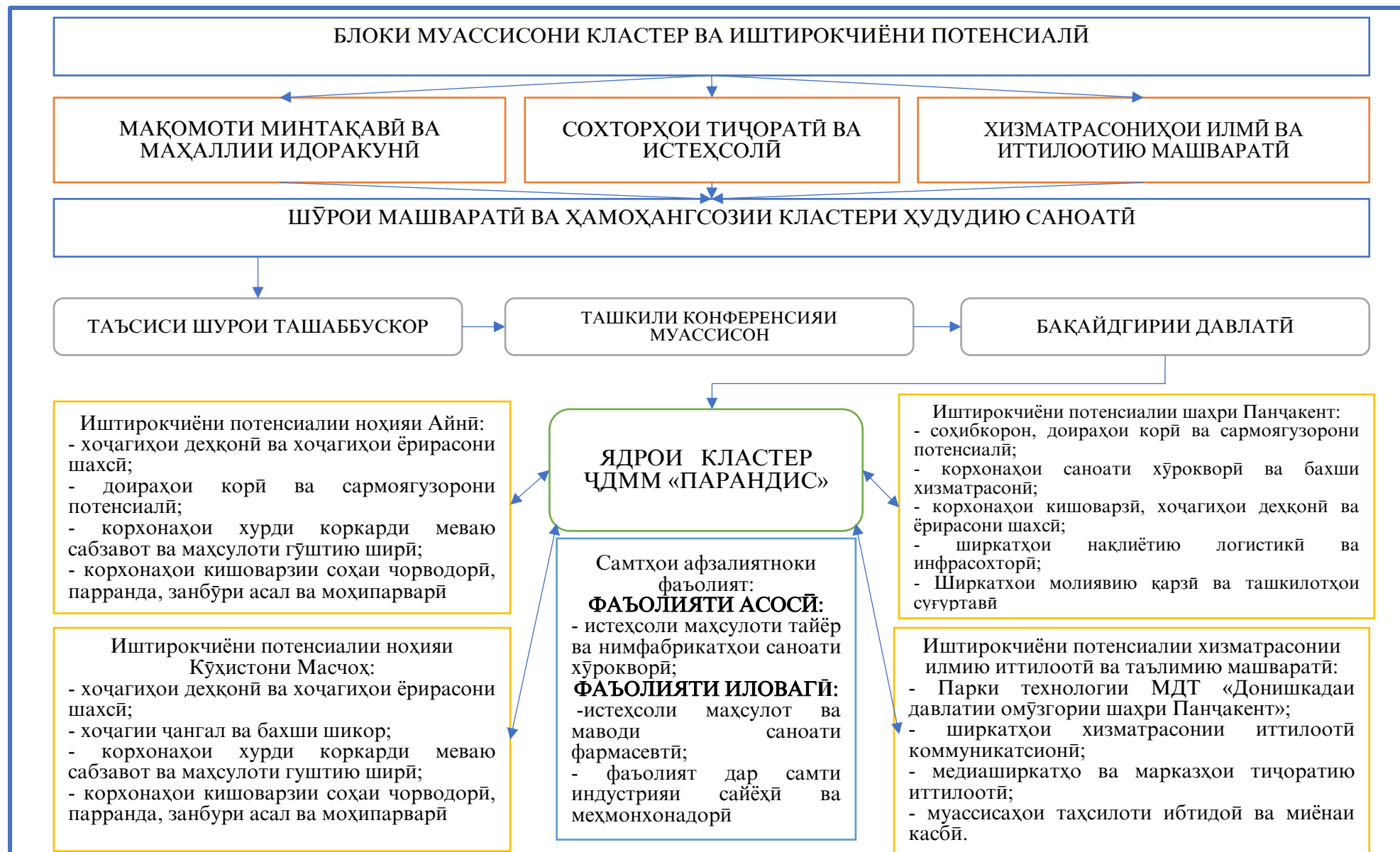
Расми 6. Модели кластери ҳудудию саноатии «Зарафшон» Сарчашма: таҳияи муаллиф