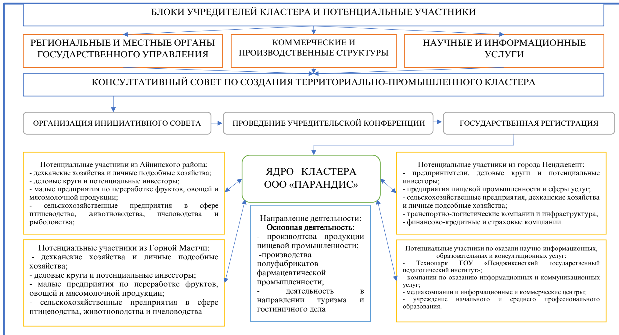
Рисунок 6. Модель территориально-промышленного кластера «Зарафшон»