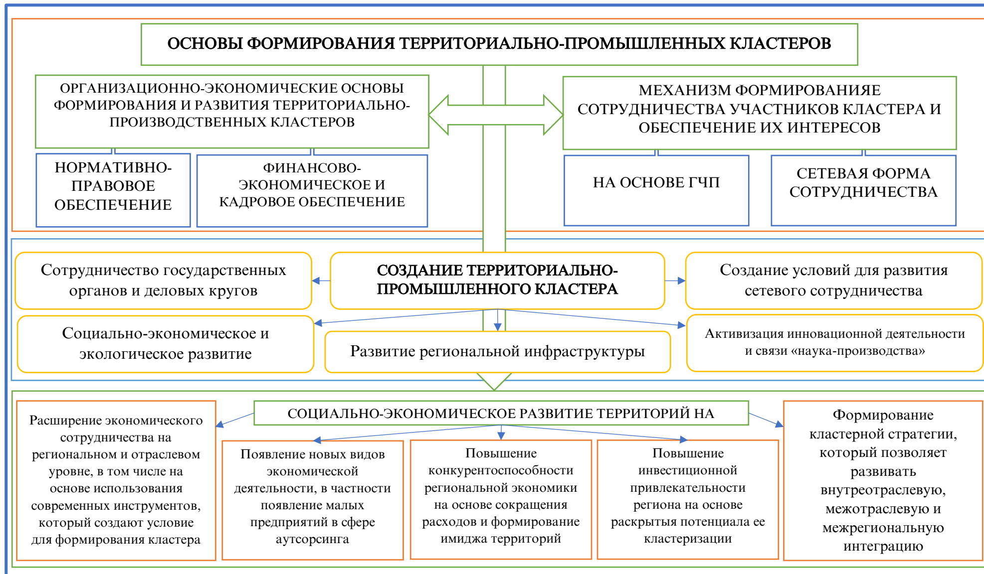
Рисунок 2. Системно-синергетический подход к организации территориально-промышленных кластеров в регионе