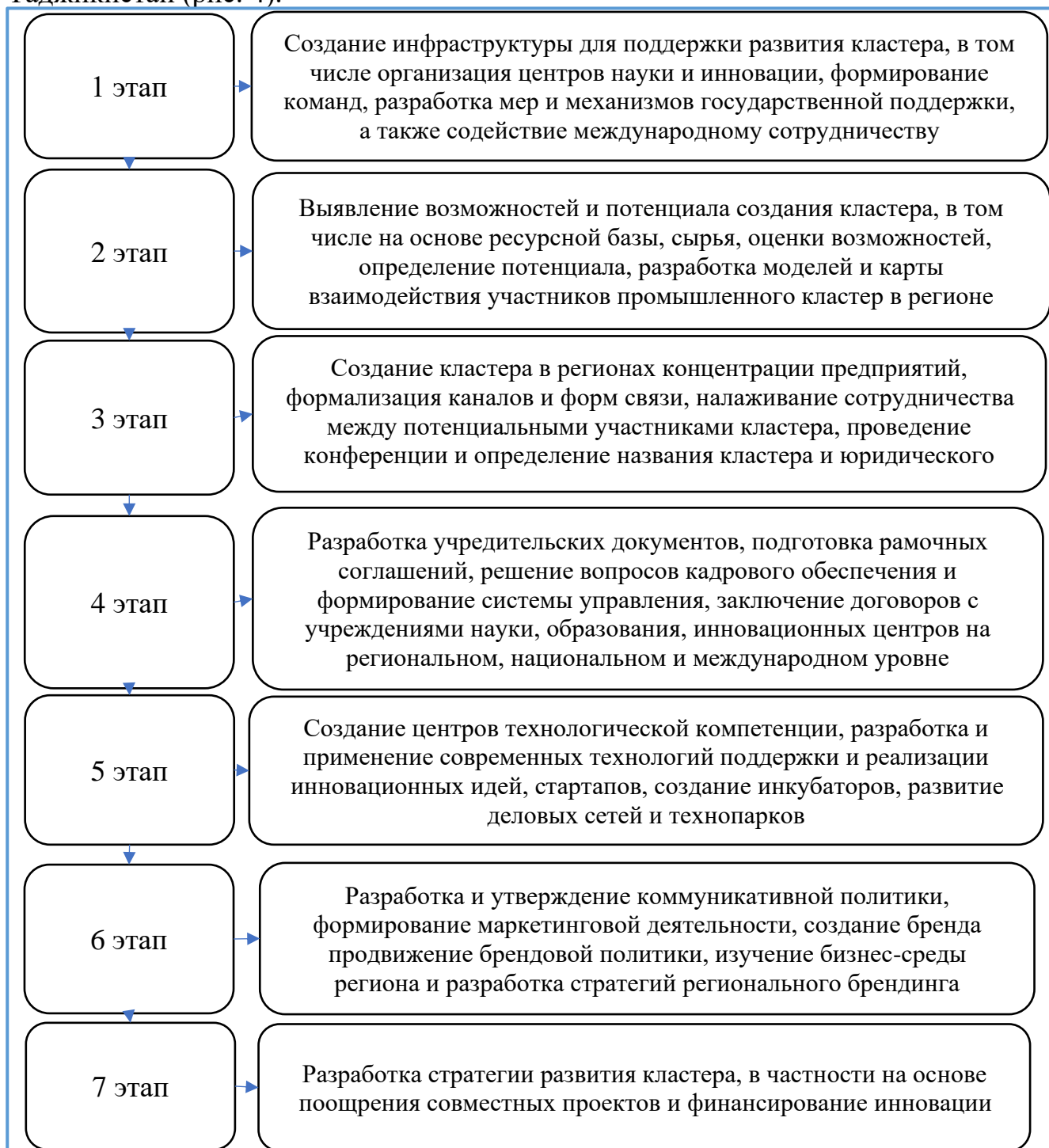
Рисунок 1. Алгоритм создания промышленных кластеров в регионах Республики Таджикистан

Республике Узбекистан, Российской Федерации, Казахстане, Финляндии и других развивающихся странах, в диссертации разработан алгоритм организации территориально-промышленных кластеров в регионах Республики Таджикистан (рис. 4).