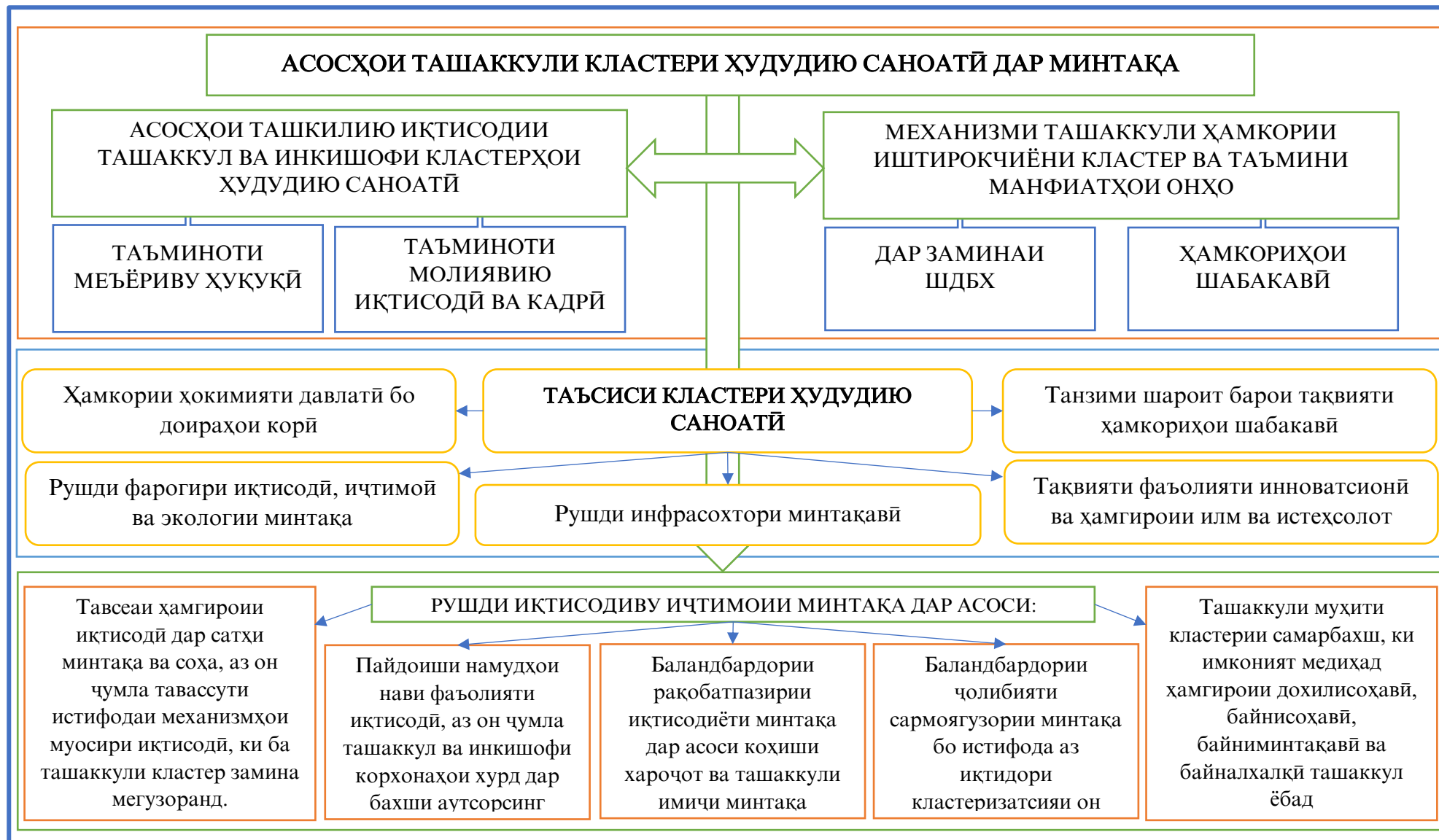
Расми 2. Равиши системавӣ-синергетикии ташаккули кластерҳои ҳудудии саноатӣ дар миқтақа