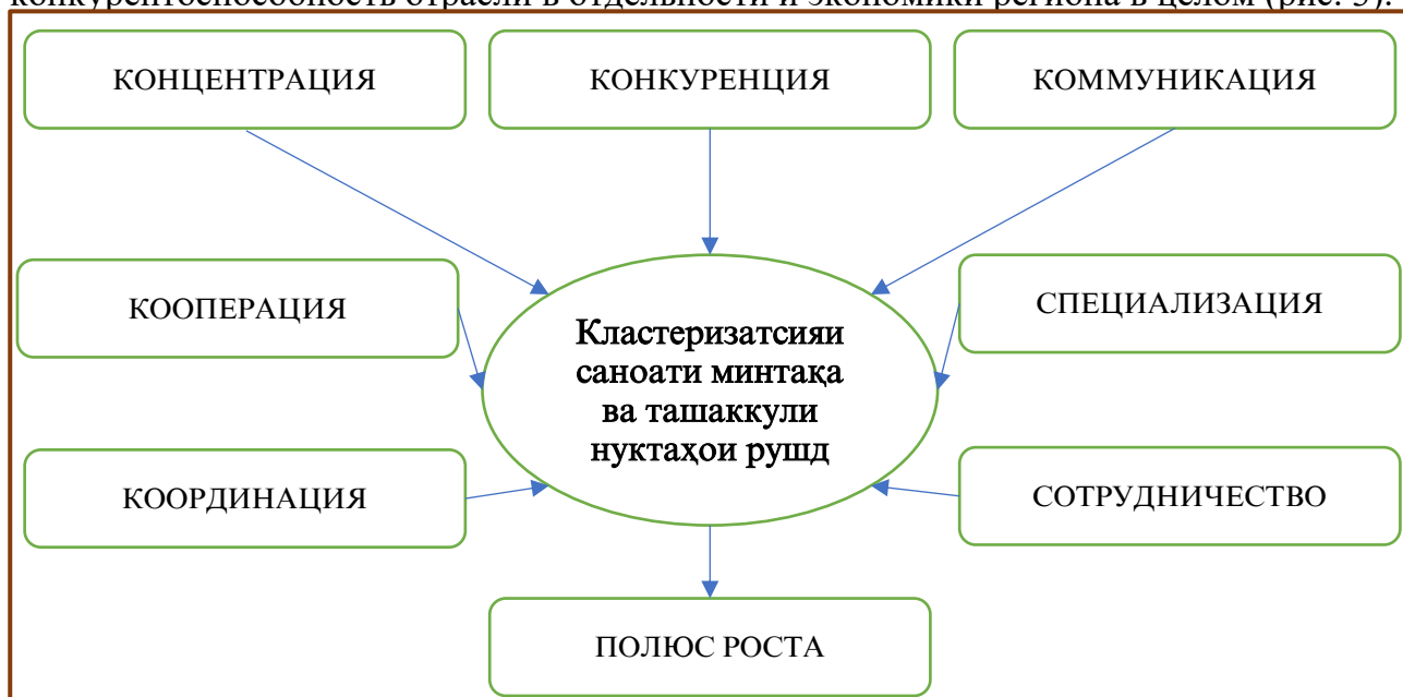
Рисунок 3. Составляющие политики кластеризации промышленности региона

С учетом потенциала и потенциала кластеризации экономики Зеравшанского региона доказано, что создание региональных промышленных кластеров будет способствовать расширению концентрации производства, его специализации, координации и интеграции промышленного производства, повысить конкурентоспособность отрасли в отдельности и экономики региона в целом (рис. 3).