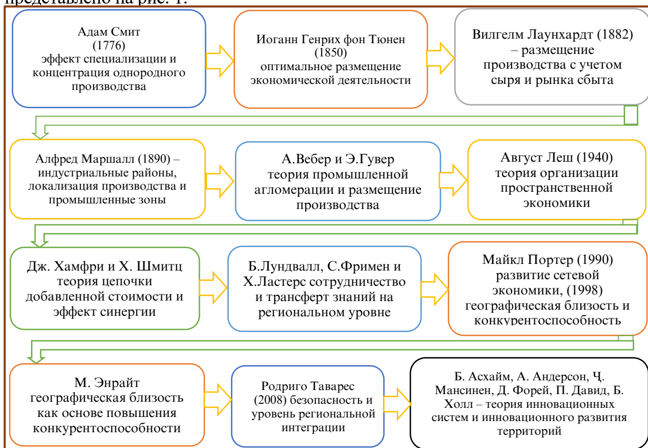
Рисунок 1. Этапы формирования и развития теории промышленных кластеров

Исследование показало, что географическая близость на современном этапе развития не может быть основным критерием создания кластера, поскольку в условиях распространения цифровых технологий и формирования современных логистических и транспортных сетей отдельные элементы территориально-промышленных кластеров могут располагаться в другом регионе или даже государстве. В этом случае научные и образовательные учреждения, лаборатории и компании, оказывающие цифровые услуги могут функционировать за пределами региона расположения кластера. Основы становления и развития теории территориально-промышленных кластеров свидетельствуют о том, что на определенных этапах в ее содержание вносились существенные изменения, и современная теория не так уж сильно отличается от классической теории кластера. В результате проведенного исследования нами выделены основные этапы формирования и развития территориально-промышленных кластеров, что представлено на рис. 1.